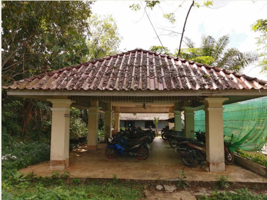
โรงจวดรถขวงกลาง