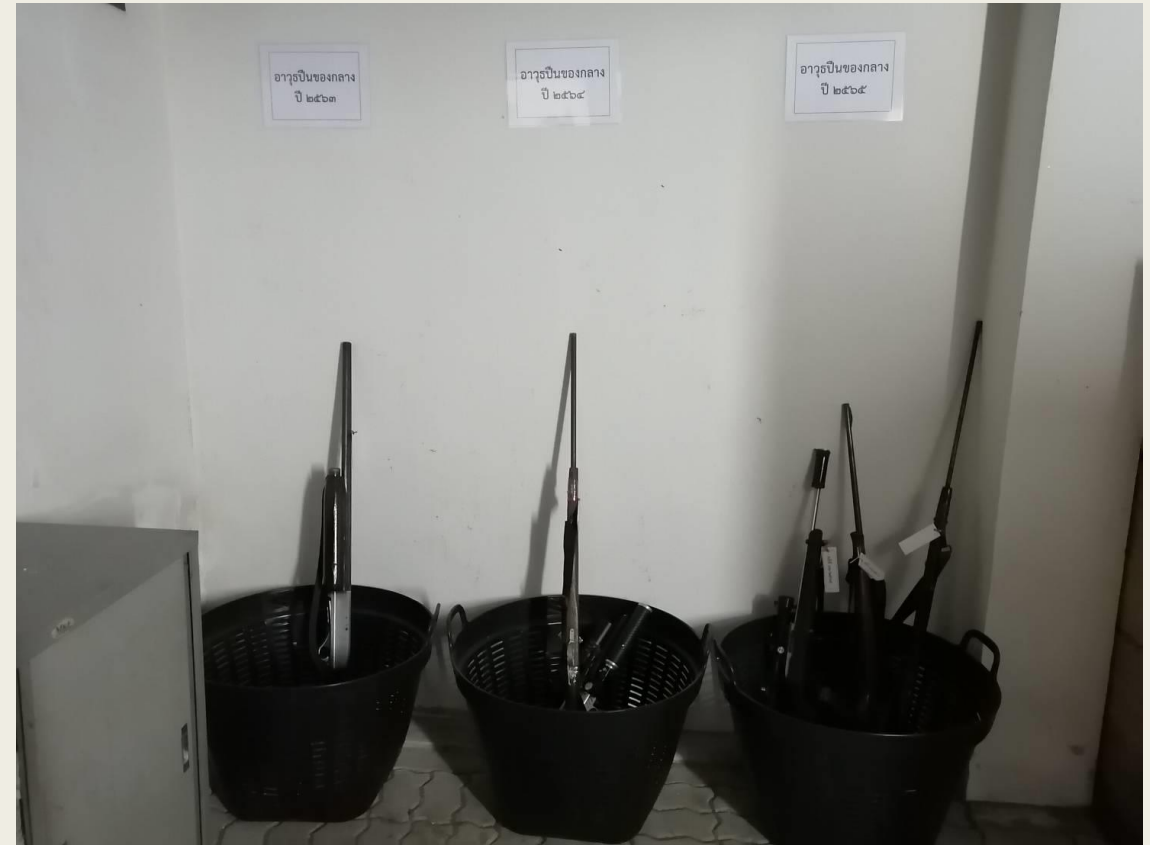
แยกอาวุธปืนแต่ละปี